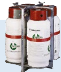
Foto 280 Liter = 4 flessen gekoppeld, één aansluitingspunt. Sapac PUR schuim systeem met compleet gesloten & hervulbare component flessen. Verschillende grootten van flessen verkrijgbaar naargelang uw verbruik van schuim: 70 Liter - 280 Liter - 500 liter, allen op dezelfde manier aansluitbaar op de machine.

Verschillenden grootten van folierollen zijn verwerkbaar op de Bagpacker. U heeft een brede keuze tussen 500, 600 & 800 mm rol. Mits optie zelf mogelijk tot 1050 mm en dit alles naar gelang uw specifieke toepassing.