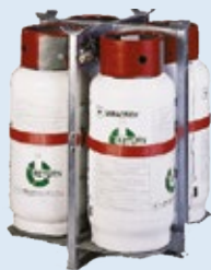
70L of 280L stalen ruilflessen