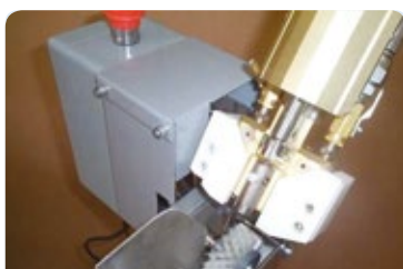
Top gun cleaner in optie leverbaar